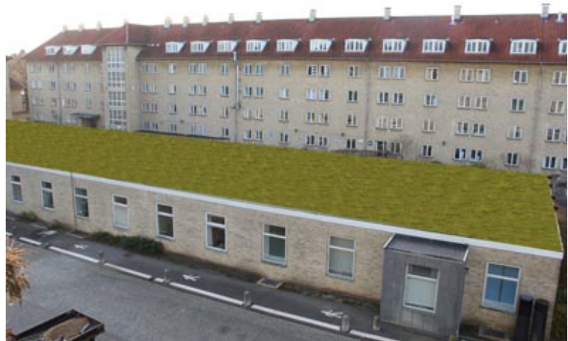
... så ville udsigten fra opgang 3 være lidt kønnere!

Hospitalet vil undersøge, om der kan laves grønne tage på udvalgte bygninger