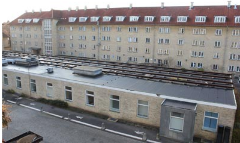
Hvis Gentofte Hospital havde grønne tage...

Hospitalet vil undersøge, om der kan laves grønne tage på udvalgte bygninger