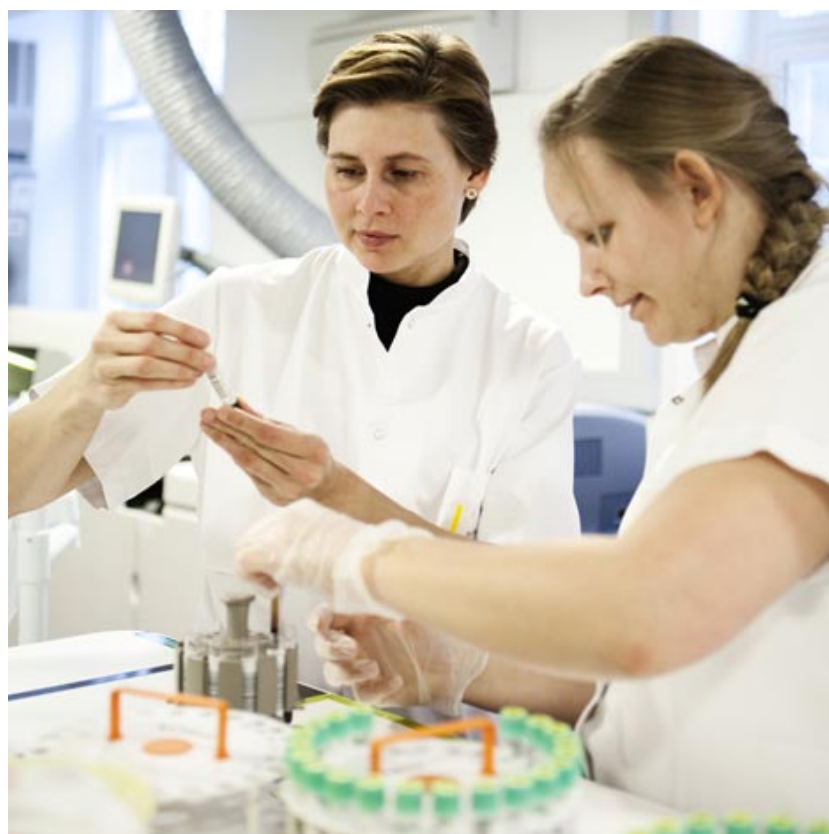
Klinisk biokemisk afdeling har stor betydning for forskningsmiljøet på Gentofte Hospital.