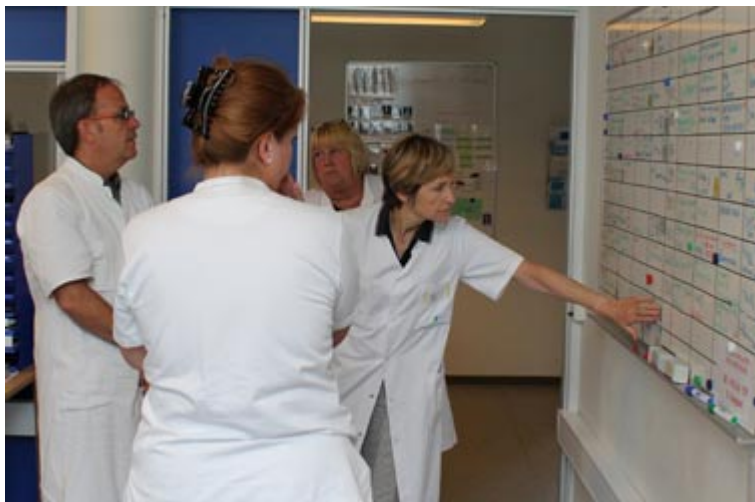
Patientsikkerhedsrunden fokuserer også på, hvordan afdelingen håndterer vejledningen om lægelig revurdering i hverdage og weekender

Patientsikkerhed er blevet en integreret del af arbejdet, og folk rapporterer, hvis noget ikke er i orden