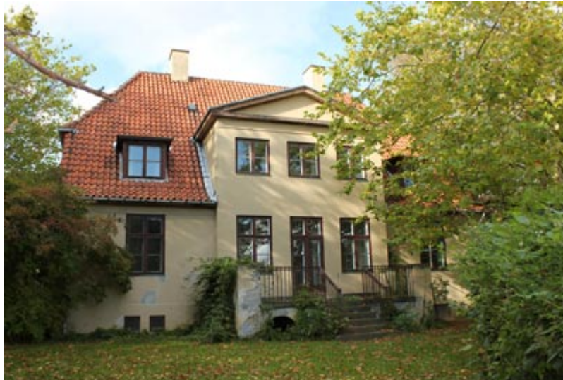
De to villaer ved rundkørslen blev i sin tid bygget til hospitalets to overlæger – en kirurgisk og en medicinsk

I stedet indrettes den gamle overlægebolig, der også går under navnet Uddannelsesvillaen, til mødelokaler for Gentofte Hospital. Det er den ene af de to villaer, der ligger tæt ved den runde parkeringsplads.