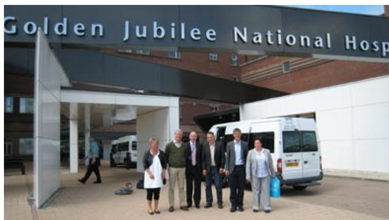
Den skarpseende læser vil kunne se, at det er medarbejdere fra Gentofte Hospital, der står i indgangen til Golden Jubilee National Hospital.